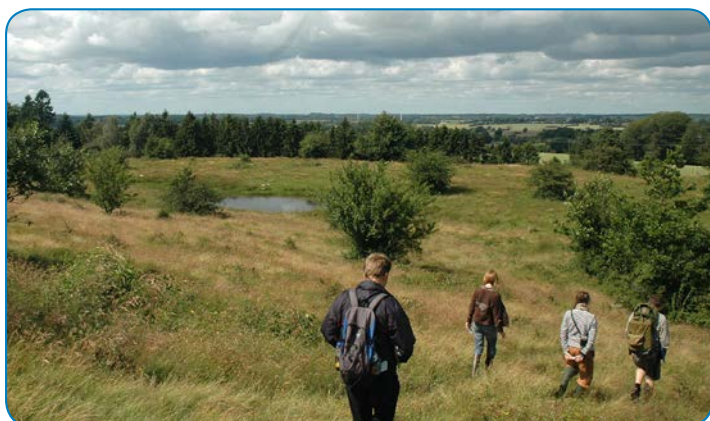
Rødme Svinehaver har aldrig været opdyrket. Græsning gennem flere hundrede år har skabt det artsrige overdrev.