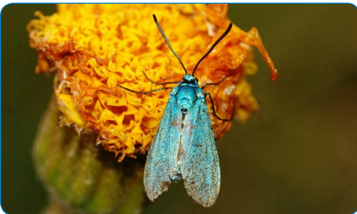
Metalvinge på guldblomme kan studeres i Rødme Svinehaver.