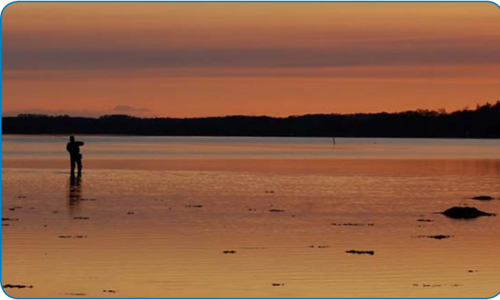
Lystfisker i solnedgangen.