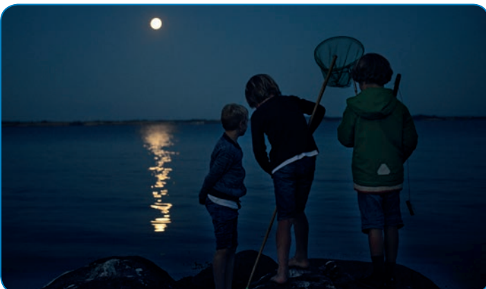
En sommernat i måneskin ved Elsehoved.