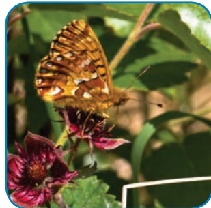
Moseperlemorsommerfugl er sjælden, men lever i Skovholm og Ravnebjerg moser.