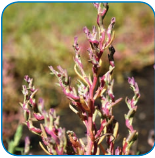
Tangurt farver strandengene røde om efteråret. Den kan kendes på de snoede stængler.