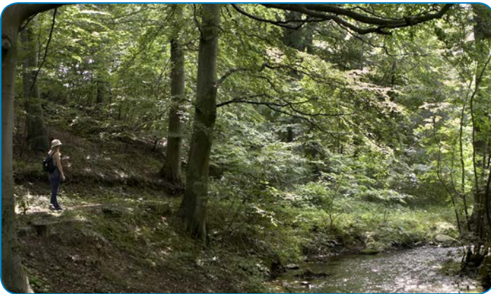
Fordybelse ved Vejstrup Å.