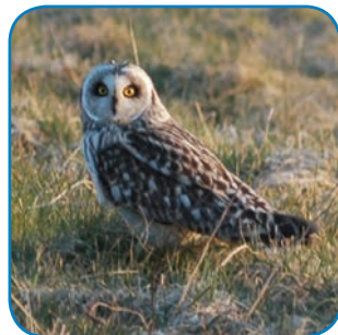
Mosehornuglen både yngler og overvintrer på øerne i Øhavet.