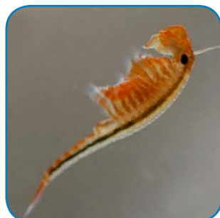
Forårsfereje er en urgammel art. Den bliver 2-3 cm lang.