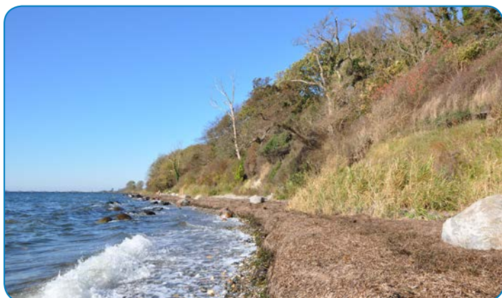
Præstens Skov ved Ballen er en stævningskov. Skoven er også præget af sin nærhed til kysten med store vedbend.