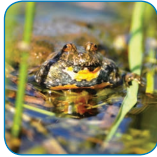
Klokkefrøen findes på Østfyn og øerne i Øhavet. Dens kvækken lyder, som når man blæser i en hul flaske.