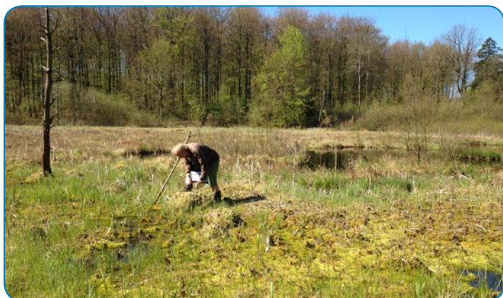
Skovholm Mose er en hængesæk, der er dannet af spagnummosser. Her lever flere af vores mest sjældne arter.