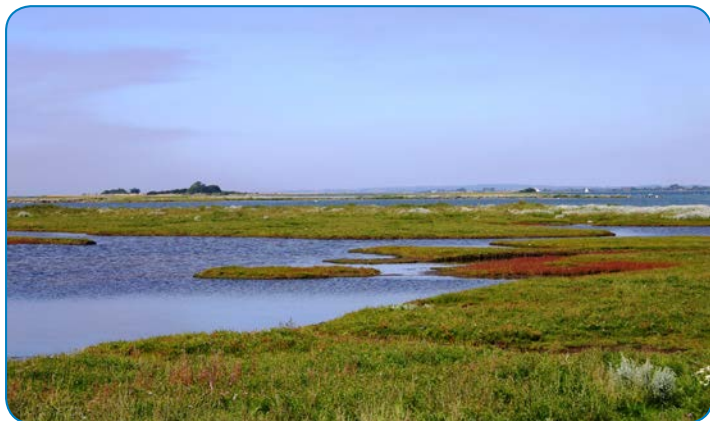
Det Sydfynske Øhav er et oversvømmet istidslandskab, hvor bakkerne når op over vandet og bliver til øer og holme.